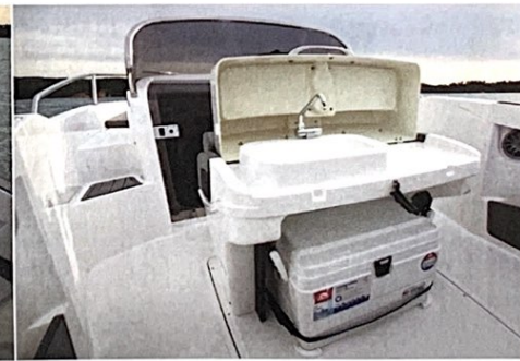
Une glacière Igloo optionnelle de 51 litres se charge de conserver les boissons fraîches sur le modèle essai.