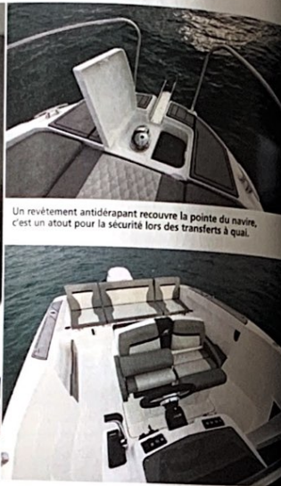
Un revêtement antidérapant recouvre la pointe du navire, c'est un atout pour la sécurité lors des transferts à quai.