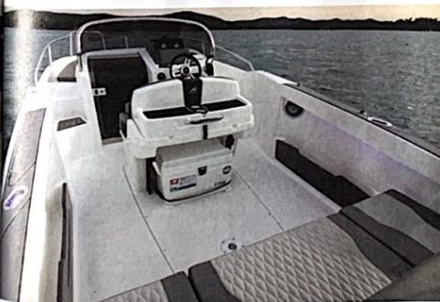
Des équipets logés dans les pavois sont à signaler. Remarquez aussi la belle largeur des plats-bords, de surcroît antidérapants !