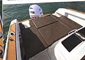
Le salon de cockpit se module facilement en grand solarium de 1,90 x 1,36 m en basculant les dossiers.