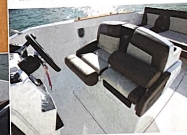
Les sièges de pilotage disposent chacun d'une assise releveable pour se tenir en position verticale.