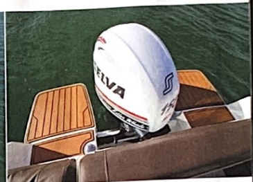
Les plateformes de poupe antidérapantes offrent de belles dimensions avec 0,65 x 0,60 m.