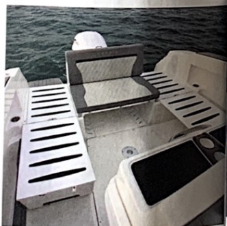
Ici, seuls les dossiers latéraux sont basculés afin de former un salon en U (sellerie absente sur l'image).

Leaning-post weekender ■ Sièges (2 599 €) ■ Sièges pilote pivotant entièrement réglables (1 439 €) ■ Cockpit autorideur sonore ■ Extension coussin bâbord arrière (190 €) ■ Extension coussin tribord arrière (199 €) ■ Coussin central (329 €) ■ Cuisinière à gaz (369 €) ■ Réfrigérateur/freezer 41L (1 289 €) ■ Glacière Igloo 51L (179 €) ■ Table cockpit amovible (359 €) (1 169 €) ■ Coussin de glacière (169 €) ■ Groupe d'eau douce + douche de pont (669 €) ■ Glacière 150 L sous siège avec surpiques orange (239 €) ■ Sellerie brun + Espresso + double-tone (239 €) ■ Sellerie gris anthracite double-tone